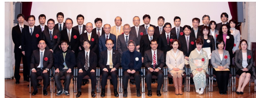
社会人基礎力を育成する授業30選受賞者