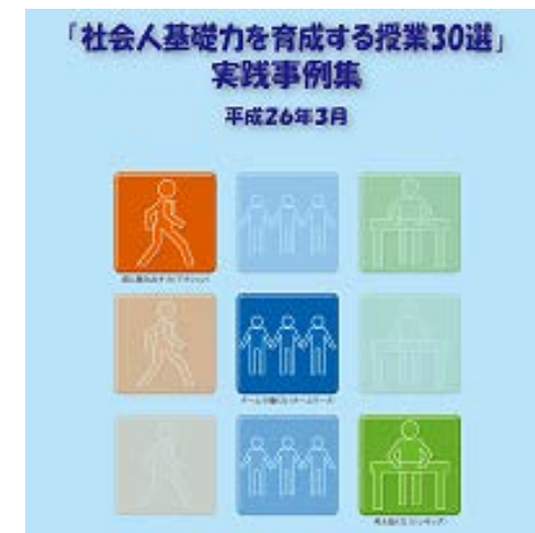
実践事例集の作成

「京都府」と連携して、京都府の政策の一つ「京都おもいやり駐車場利用証制度」を取り上げている。学生たちは、府の担当者とともに考え、解決策を検討し、実現可能性を探り、提言を行う中で、社会人として必要な視点と力を身につけていく。